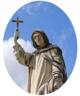
Omiletica dei Padri de L'Isola di Patmos

Chi è fedele in cose di poco conto, è fedele anche in cose importanti; e chi è disonesto in cose di poco conto, è disonesto anche in cose importanti. Se dunque non siete stati fedeli nella ricchezza disonesta, chi vi affiderà quella vera? E se non siete stati fedeli nella ricchezza altrui, chi vi darà la vostra?