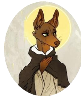
Omiletica dei Padri de L'Isola di Patmos

Sin dal battesimo l'Eterno Padre ha posto il suo compiacimento anche su di noi, perché nel Battesimo siamo diventati figli di Dio per adozione. Riscopriamo quindi il nostro Battesimo come via di Trasfigurazione. Perché diventare santi vuol dire diventare sempre più lucenti, di una bellezza più alta e più grande. Una bellezza che è richiamo alla stessa vita della Trinità.