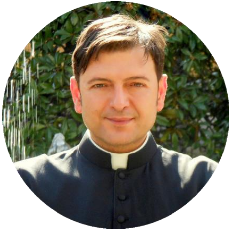
Autore Ariel S. Levi di Gualdo

Grazie ai Social Media molti, raggruppati in fitte legioni di stolti sempre più agguerrite, oltre che peggiori della biblica invasione delle cavallette, si auto-formano di regola a questo modo: prima spiluccano da un blog all'altro, poi si cimentano nell'uso di parole di cui non conoscono neppure il significato etimologico – ma soprattutto il significato che hanno nel linguaggio filosofico, metafisico e teologico-dogmatico –, infine salgono sulla cattedra di Facebook o di Twitter per dare lezioni di corretta dottrina a noi teologi, sparando una dietro l'altra assurdità a raffica, spesso anche in modo violento e aggressivo.