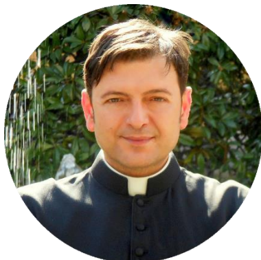
Autor Ariel S. Levi di Gualdo

Si abrieron el proceso de beatificación de la primera santa hereje, también se puede abrir el del monstruo de Florencia, y después de la canonización promocionarlo como copatrón de los enamorados junto a San Valentín. Tanto, respecto a los de la Congregación para las Causas de los Santos ya no hay nada que pueda sorprender.