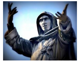
Omiletica dei Padri de L'Isola di Patmos

Pescare gli uomini nella rete di Dio vuol dire proprio toglierli da un'ottica immanente, priva di riferimenti assoluti e priva di senso ultimo, per portarli invece in un orizzonte più ampio e profondo. Fra le centomila parole che sentiamo dalle televisioni, dai social media , dalle radio, da Youtube , da Tik Tok e che sono spesso inopportune e prive di realtà, è bene che nella nostra vita risuoni la Sacra Scrittura, la storia delle storie scritta da Dio per noi.