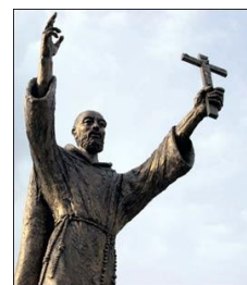
L'angolo dell'omiletica dei Padri de L'Isola di Patmos

Dov'è Dio? È anche inutile pensare a una risposta che si basi sulla sola ragionevolezza o che interpelli la teologia razionale, al fine di farci familiarizzare con una realtà come la morte che è sì naturale ma mai totalmente accettata. Nel momento della perdita di una persona cara, la ragione è fragile.