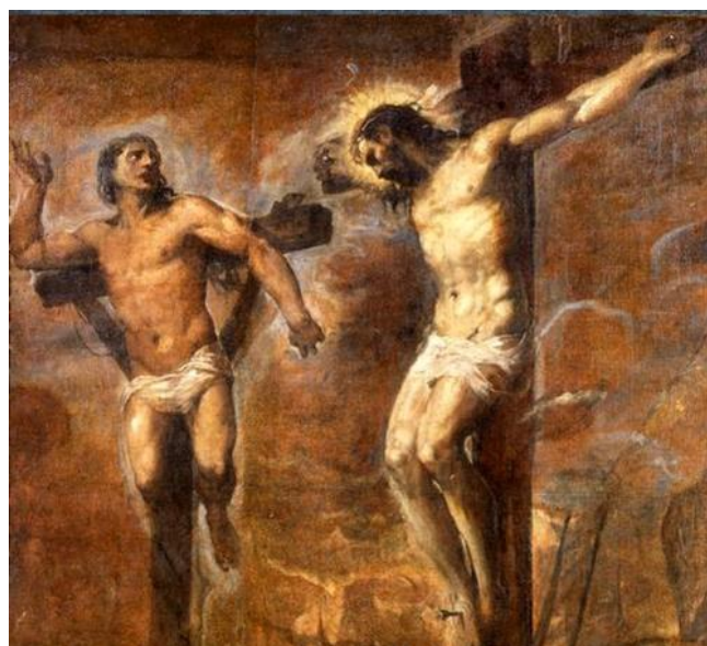
Cristo e il Buon Ladrone, opera di Tiziano Vecellio (1477 - 1576)

In ciò risiede il vero significato della regalità di Cristo , egli non salva sé stesso alla maniera