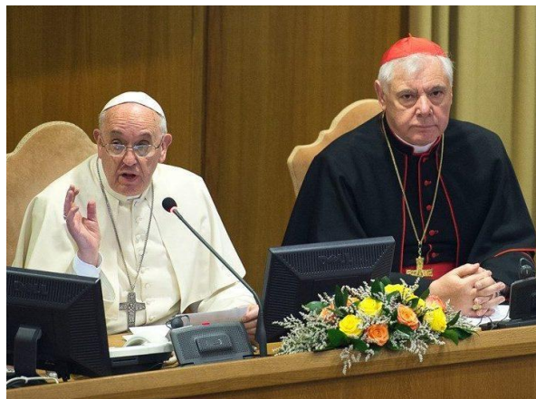
il Sommo Pontefice Francesco I e l'allora Prefetto della Congregazione per la dottrina della fede Cardinale Gerhard Ludwig Müller durante una sessione dell'ultimo Sinodo sulla

Luis Badilla , su Il Sismografo del 27 settembre, dimostrando carenza di cultura teologica e ignoranza della storia della teologia, ha insultato in modo sfrontato il Cardinale Gerhard Ludwig Müller per la sua proposta saggia e opportuna di istituire una commissione cardinalizia che chiarisca, mediante franca e fraterna discussione, cum Petro e sub Petro , gli ormai noti e segnalati punti poco chiari della Amoris Laetitia [cf. Il Sismografo , QUI ].