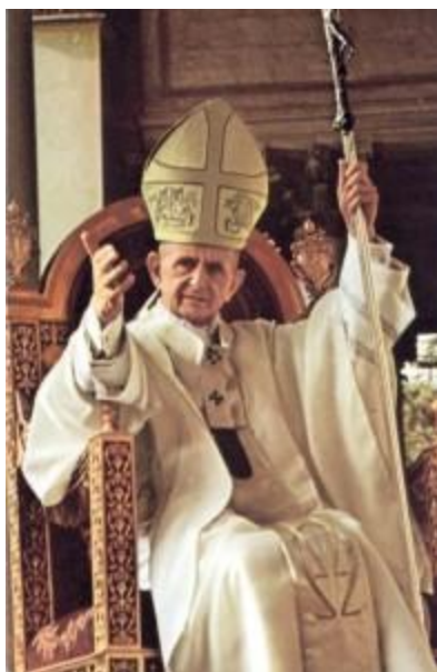
Paolo VI sulla sedia gestatoria, di cui fece uso per l'ultima volta Giovanni Paolo I

È la stessa falsa lettura che vien fatta dal Vescovo Marcel Lefèbvre, perché a ben vedere gli estremi si toccano. Il tutto con una differenza: mentre il Cardinale Walter Kasper se ne compiace come di un «progresso» o un «cammino», il Vescovo Marcel Lefebvre se ne dispiace come di smentita della Tradizione. Ma lo sbaglio dei due è comune: vedere nel Concilio un modernismo che non esiste, rifiutando i chiarimenti adottati da tutti i Papi del post-concilio.