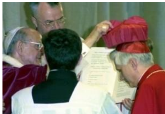
Paolo VI impone la berretta cardinalizia all'Arcivescovo di Monaco di Baviera Joseph Ratzinger, che succederà nel 2005 a Giovanni Paolo II

La cosa grave , in sintesi, è che il Cardinale Walter Kasper pare insinuare che tra le dottrine del Concilio si siano comunque infiltrate certe tesi neomoderniste che Paolo VI avrebbe voluto impedire, ma alle quali si sarebbe rassegnato lasciandole giustapposte a quelle ortodosse al «prezzo» di «un enorme potenziale conflittuale».