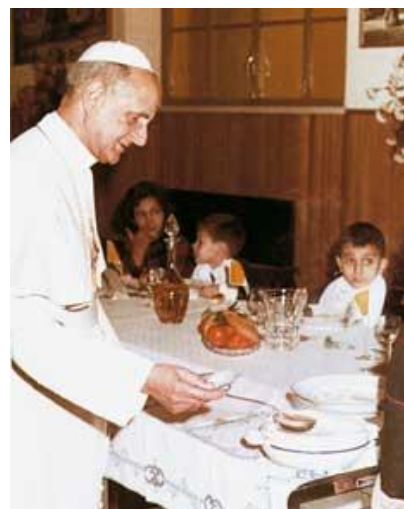
Paolo VI, serve il pranzo ai bambini vincitori del concorso per il più bel presepe, 30 gennaio 1966

È vero che Paolo VI , dopo il Santo Pontefice Giovanni XXIII, permise al Concilio la presenza di Karl Rahner e di altri criptomodernisti. Fece bene? Fece male? È difficile giudicare. Sta comunque di fatto che, come risulta dagli studi che sono stati fatti sul contributo di questi periti, essi nell'assemblea conciliare offrirono un contributo innovatore ma sostanzialmente nei limiti dell'ortodossia. E come avrebbe potuto essere diversamente?