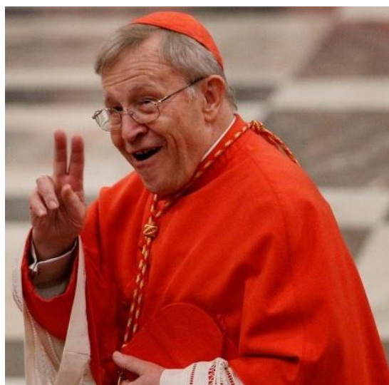
il Cardinale Walter Kasper

In un articolo su L'Osservatore Romano del 12 aprile 2013 sotto il titolo Un Concilio ancora in cammino , [testo QUI ] il Cardinale Walter Kasper, ad un mese e poco più la rinuncia del Sommo Pontefice Benedetto XVI e l'elezione del Pontefice regnante, afferma che Paolo VI, nel tentativo di impedire formulazioni proposte da una maggioranza progressista che lo preoccupava, «coinvolse» la minoranza tradizionalista permettendole di introdurre alterazioni nella redazione, che attenuavano o confondevano il senso dei passi modernizzanti.