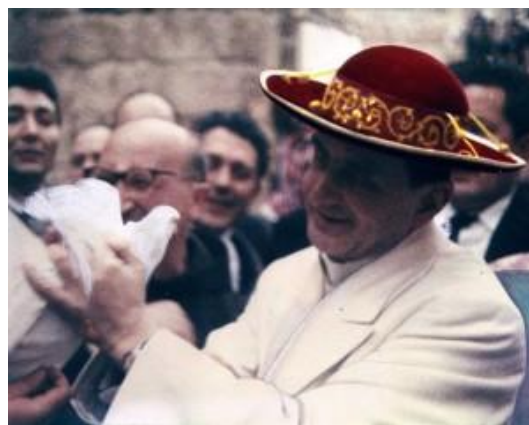
Paolo VI, riceve in omaggio una colomba

Parlare dunque di «enorme potenziale conflittuale» è un'offesa gravissima fatta alla sapienza soprannaturale delle dottrine del Concilio, quasi ci trovassimo davanti a dei pateracchi politici o ai conflitti della dialettica hegeliana, ed è quindi fraintendere completamente i risultati equilibrati e coerenti dei dibattiti conciliari, dove, grazie all'assistenza dello Spirito Santo, i Padri, giunti ad un fraterno accordo, hanno saputo offrirci una conoscenza più avanzata della Parola di Dio senz'alcuna impensabile rottura o contraddizione col patrimonio dottrinale precedente il Concilio.