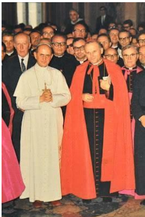
Paolo VI con il Cardinale Karol Wojtyła, che nel 1978 succederà a Giovanni Paolo I col nome di Giovanni Paolo II

In questo articolo , il Cardinale dichiara inoltre che «neanche la ricezione ufficiale è rimasta ferma. In parte, ha superato il Concilio», come a dire, a quanto pare, che nel Concilio affermazioni ortodosse e moderniste stanno le une accanto alle altre, come se poi il lettore potesse scegliere quelle che preferisce, a meno che non si ponga su di una posizione contraddittoria dando un colpo al cerchio e uno alla botte.