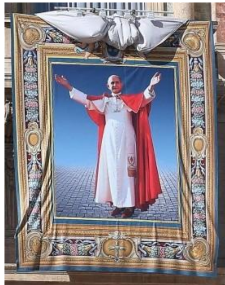
19 ottobre 2014, l'arazzo scoperto sotto la loggia centrale della Papale Arcibasilica di San Pietro per la beatificazione del Sommo Pontefice Paolo VI

In certo senso alcune indicazioni del Concilio sono superate, non però che siano state abbandonate, ma nel senso che sono vissute meglio e più santamente in conformità alle nuove situazioni che non esistevano all'epoca del Concilio, ma sempre ovviamente in continuità col patrimonio immutabile di fede consegnato da Cristo una volta per sempre alla Chiesa da trasmettere inalterato a tutta l'umanità fino alla fine dei secoli.