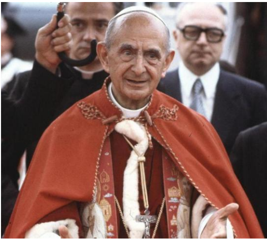
Paolo VI, immagine dell'anzianità, anno 1977

Chi crede di dover scegliere nel Concilio tra un tradizionalismo e un criptomodernismo non ha capito niente dell'insegnamento del Concilio ed è solo un fautore di divisioni all'interno della Chiesa.