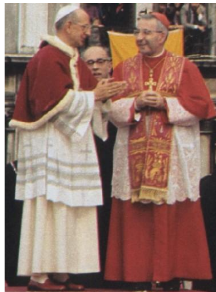
Paolo VI in visita apostolica a Venezia, ricevuto dal Patriarca Albino Luciani, che nel 1978 gli succederà al sacro soglio con il nome di Giovanni Paolo I

Secondo l'Autore di questo articolo che suona quasi come un programma attuativo per l'immediato futuro, queste "limitazioni", delle quali egli parla non modificavano del tutto gli originari testi "progressisti", cioè — diciamola con franchezza — modernisti, ma li lasciavano intatti, limitandosi a star loro accanto in modo incongruo e contraddittorio, sottintendendo in modo